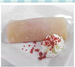
イチゴ風味でもっちり食感♡